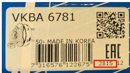
Obrázok č. 2: Štítok sady ložiska s vyobrazením dátumového kódu

Ak je ložisko namontované na vozidle bez možnosti zistenia dátumových kódov pomocou obalu, distribútori SKF alebo zákaznicke servisy môžu produkt identifikovať podľa označenia na strane kolesa, ako je uvedené nižšie.